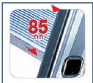
gradino piano profondo 85 mm