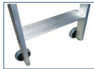
a richiesta coppia di ruote per scorrimento laterale