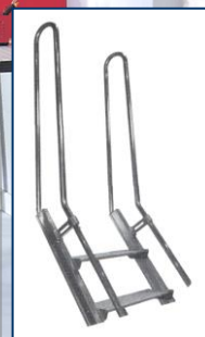
maniglioni di sbarco verticali