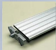
gradino largo 150 mm