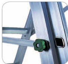
barre antichiusura in alluminio