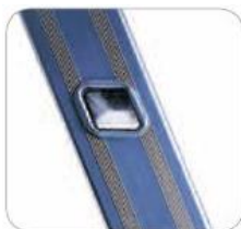
gradini a rombo senza spigoli