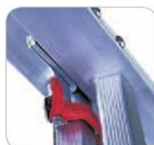
ramponi con antisfilo

• Scala in alluminio trasformabile a due, tre e a quattro rampe. DAMA è dotata di solidità strutturale particolarmente elevata con esclusivi gradini a rombo che offrono un comodo appoggio sotto i piedi, barre antichiusura in alluminio con fermi ad espansione nei gradini e dispositivi di sicurezza antisfilo sui ramponi di aggancio. Caratteristiche queste, che rendono DAMA sicuramente adatta anche ad un uso intenso e professionale.