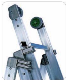
gruppo cerniera in