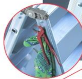
gancio per attrezzi o latta colori