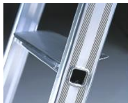
gradino largo profondo 85 mm

• Scala professionale in alluminio a doppia salita, con gradini da ambo i lati profondi 85 mm, energicamente bloccati ai montanti tramite ribordatura, senza l'ausilio di rivetti. Dotata di particolari ad alto contenuto tecnologico come le cerniere in pressofusione di alluminio, il gancio porta-latta e le pratiche linguette d'incontro che aiutano a mantenere in "asse" la scala in posizione chiusa. E' disponibile in sette misure, da 5 a 12 gradini, oltre al pratico pianetto di seduta posto alla sommità della scala.