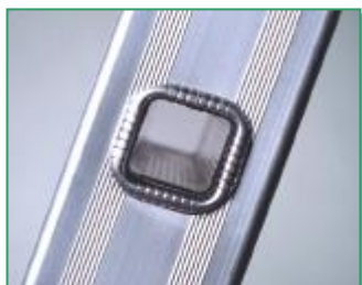
gradino quadro 30x30