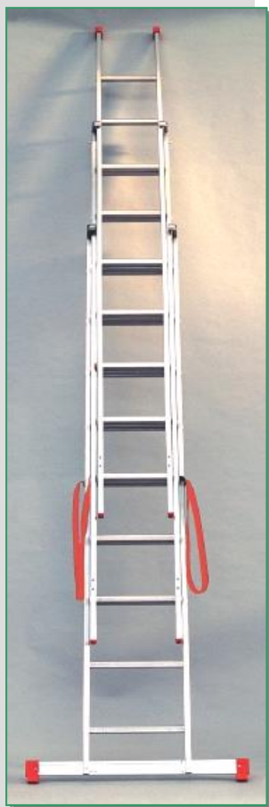
GENIA in configurazione a sfilo

Progettata e costruita per un uso prevalentemente domestico e hobbistico, GENIA è comunque realizzata con le stesse tecnologie della serie più industriale con la quale condivide materiali e dettagli costruttivi.