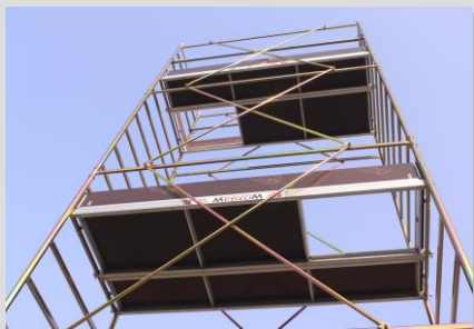
piani di lavoro con botola