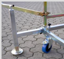
piede livellatore e ruota