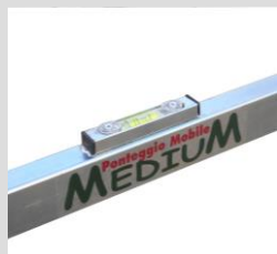
livelle applicate alla base