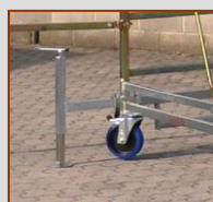
piede livellatore e