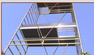
piani di lavoro con botola e fermapiEDE