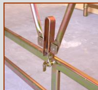
gruppo tirante con tenditore rapido a scatto