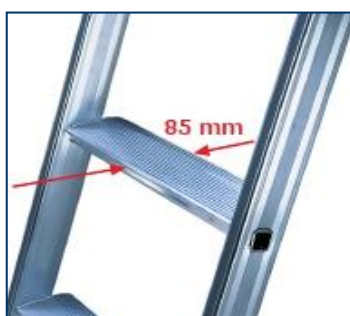
gradino largo profondo 85 mm