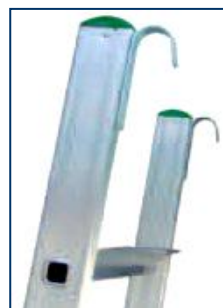
ganci di ancoraggio per fissare la scala a parete o scaffali