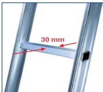
piolo a sezione romboidale da 30 mm