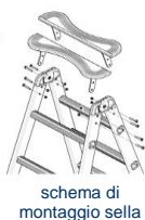
schema di montaggio sella