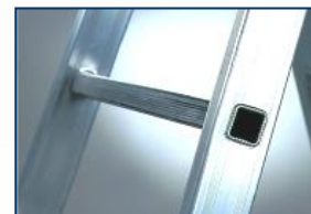
gradino quadro 30x30 ribordato