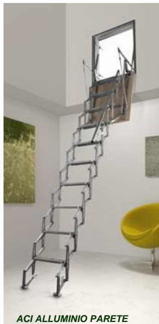
ACI ALLUMINIO PARETE

• Scala retrattile per botola indicata per l'accesso a solai e sottotetti. Realizzata sia in acciaio che alluminio per la versione a pantografo ( ACI SVEZIA / ACI ALLUMINIO ), o esclusivamente in acciaio per i modelli ACI 3 e ACI 4 , a 3 o 4 elementi ripiegabili.