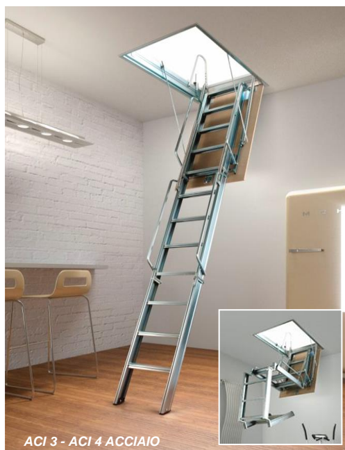
ACI 3 - ACI 4 ACCIAIO