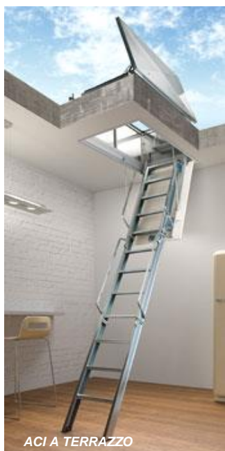
ACI A TERRAZZO

Possibilità a richiesta, di avere misure botola fuori standard, versioni per l'accesso a terrazzo con coperchio in lamiera zincata e guarnizioni di tenuta, esecuzioni speciali con botola verticale a parete (quest'ultima solo con modello ACI ALLUMINIO ).