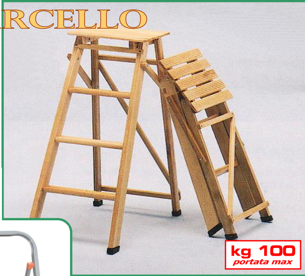
kg 100 portata max