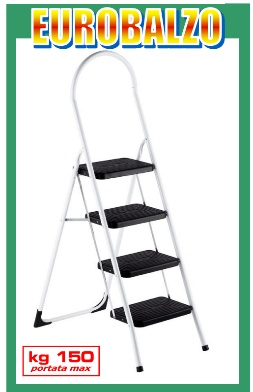
kg 150 portata max