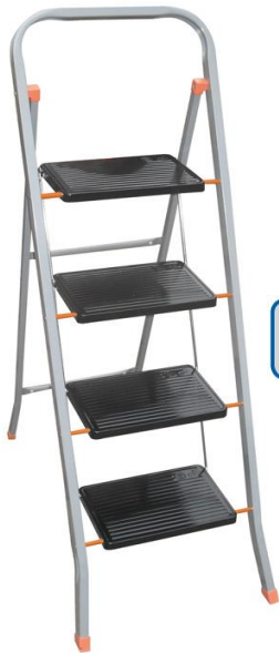
Tinto kg 150 portata max