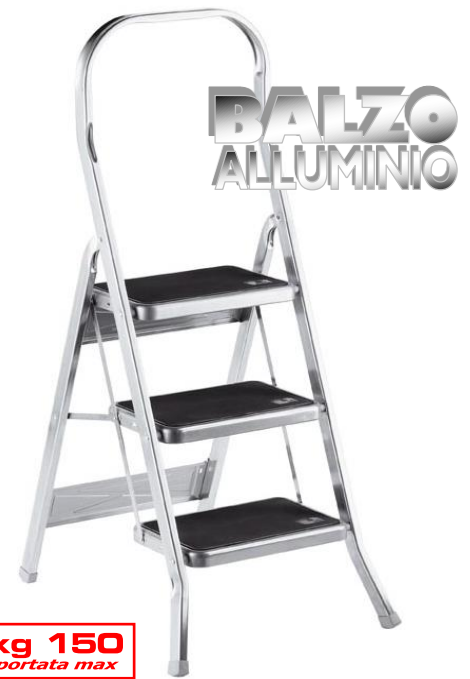
kg 150 portata max